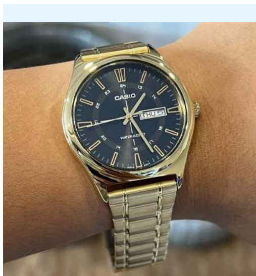
Casio Reloj para Hombre MTP- V006G-1CUDF CRC 39,800.00