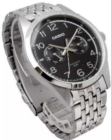
Casio WR50m Reloj para Hombre MTP-E340D-1AV CRC 69,900.00