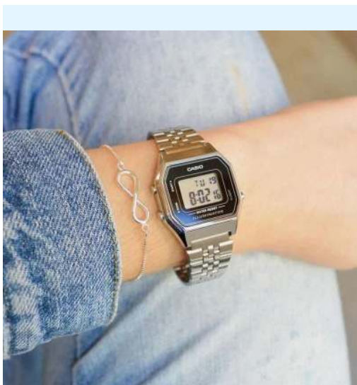
Casio Reloj para Dama / Niño LA680WA-1DF CRC 37,200.00