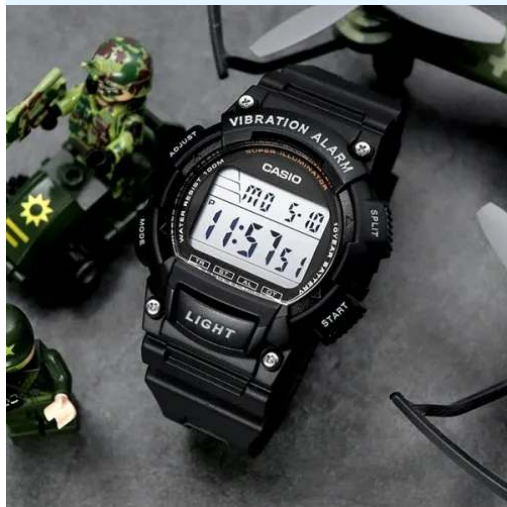
Casio Reloj W-736H-1AV CRC 39,000.00