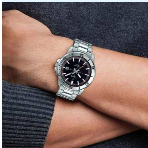
Casio Reloj para Hombre MTP- VD01D-1E2VUDF CRC 37,500.00