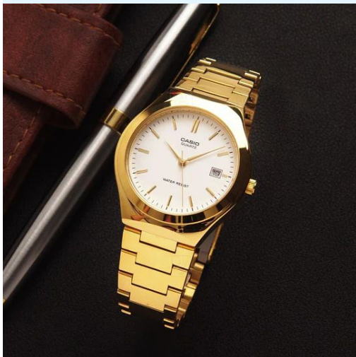
Casio Reloj Unisex MTP-1170N-7ARDF CRC 39,900.00