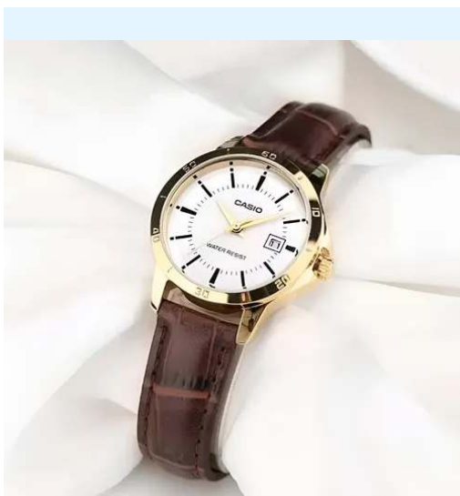
Casio Reloj para Dama LTP-V004GL-7AUDF CRC 28,700.00