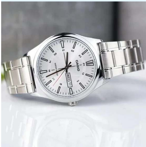
Casio Reloj MTP-V006D-7CUDF CRC 24,900.00