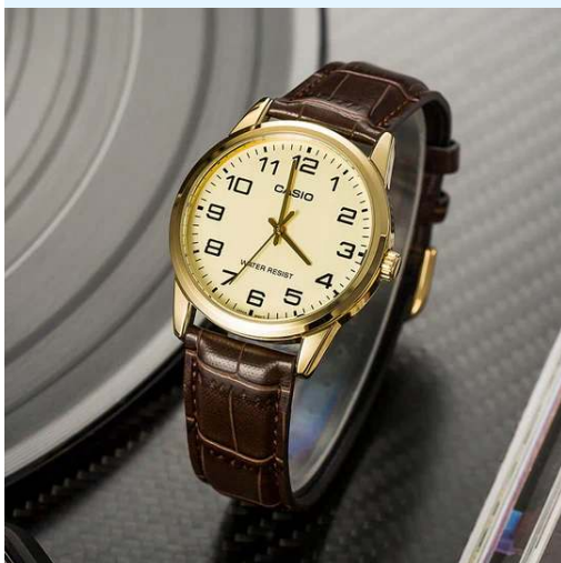
Casio Reloj para Dama LTP- V001GL-9BUDF CRC 27,200.00