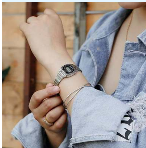
Casio Reloj para Dama / Niño LA670WA-1DF CRC 27,200.00