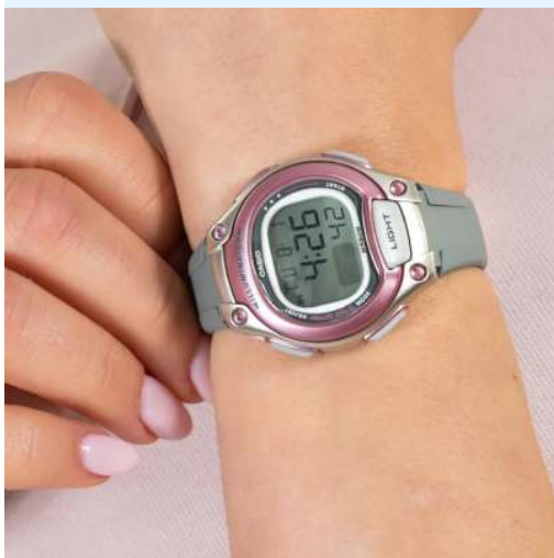
Casio Reloj para Dama LW-203- 8AVDF CRC 27,200.00