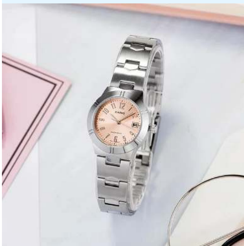
Casio Reloj para Dama LTP-1241D- 4A3DF CRC 36,500.00