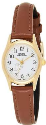
Casio LTP-1094Q-7B8RDF CRC 22,400.00