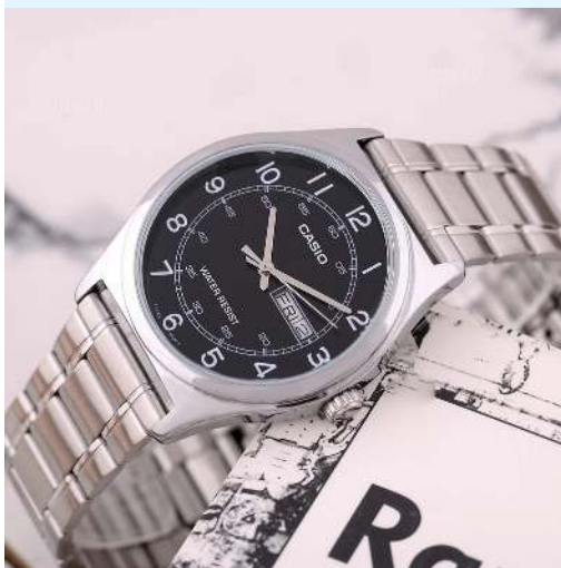
Casio Reloj para Hombre MTP- V006D-1B2UDF CRC 29,000.00