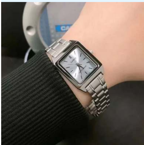
Casio Reloj para Dama LTP-V007D-2EUDF CRC 24,900.00