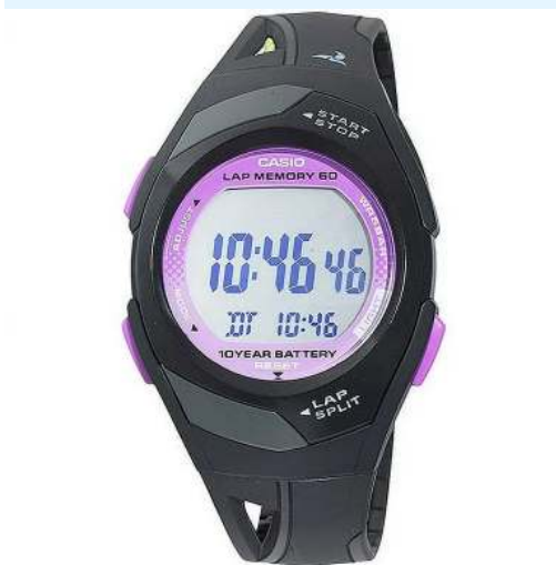
Casio Reloj Deporte STR-300-1CCF CRC 33,600.00