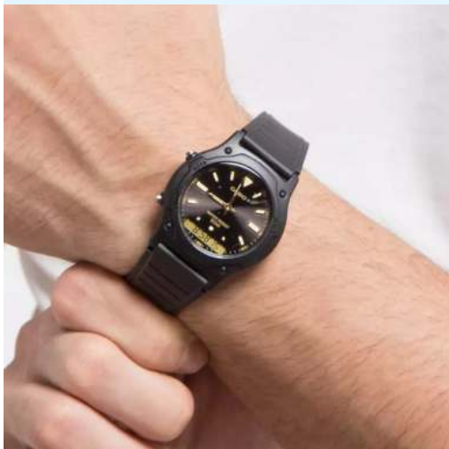
Casio Reloj Unisex AW-49HE- 1AVDF CRC 19,500.00