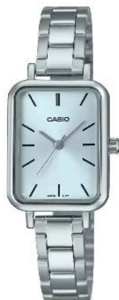
Casio Reloj para Dama LTP-V009D-2EUDF CRC 32,000.00