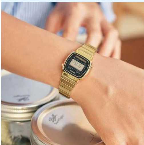
Casio Reloj para Dama LA670WGA-1 CRC 29,900.00