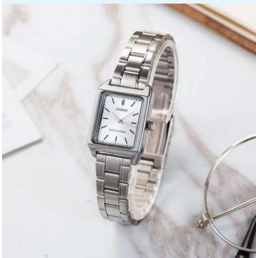
Casio Reloj para Dama LTP-V007D-7EUDF CRC 24,900.00