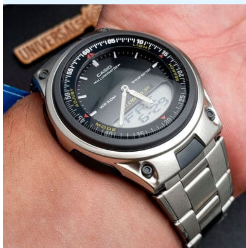
Casio Reloj para Hombre AW-80D- 1AVCB CRC 39,900.00