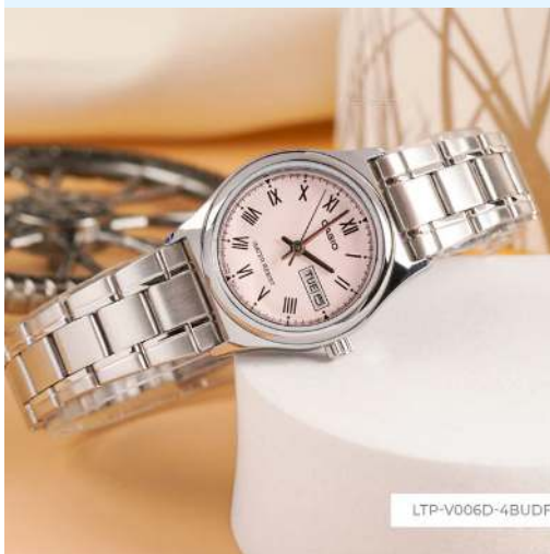
Casio Reloj LTP-V006D-4BUDF CRC 28,800.00