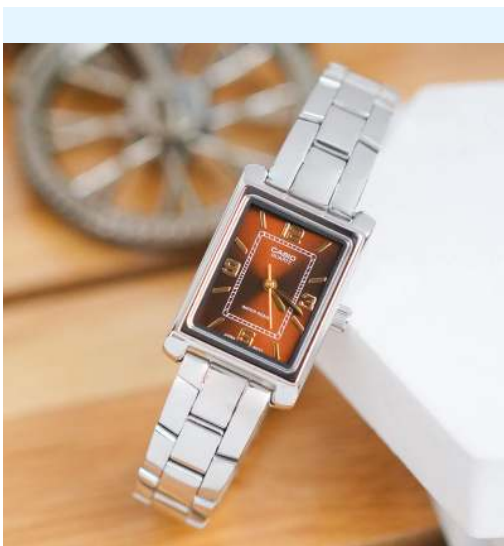
Casio Reloj para Dama LTP-1234DD-5ADF CRC 39,800.00