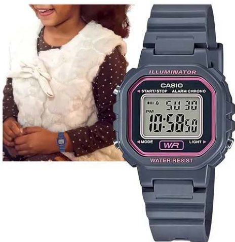
Casio Reloj para Dama / Niño LA- 20WH-8ADF CRC 19,900.00