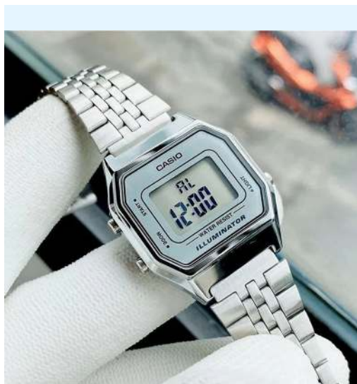
Casio Reloj para Dama / Niño LA680WA-7DF CRC 37,200.00