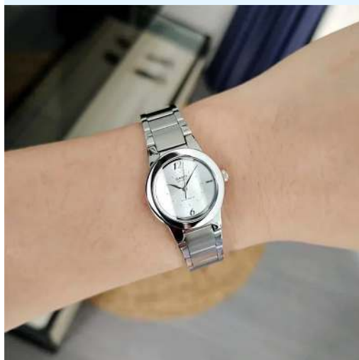
Casio Reloj para Dama LTP-1230D- 7CDF CRC 43,500.00