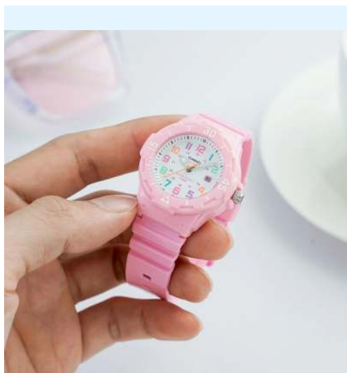
Casio Reloj para Niña LRW-200H- 4B2VCF CRC 23,300.00