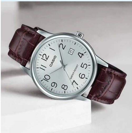
Casio Reloj MTP-V002L-7B2UDF CRC 27,500.00