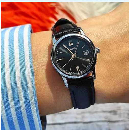
Casio Reloj para Dama LTP-V002L-1B3UDF CRC 23,900.00