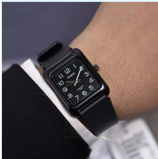
Casio WR50m Reloj MTP-B175- 1BVDF CRC 59,000.00