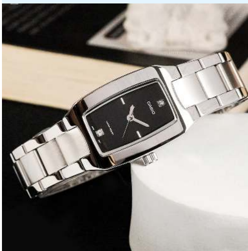
Casio Reloj para Dama LTP-1165A-1C2DF CRC 39,800.00