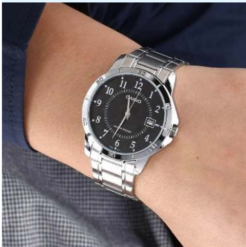
Casio Reloj MTP-V004D-1BUDF CRC 24,900.00