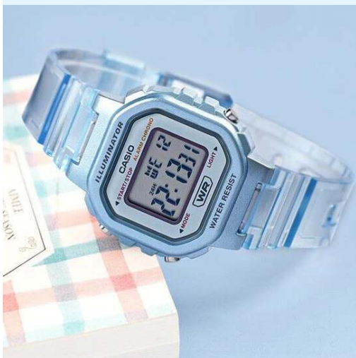
Casio Reloj para Dama / Niño LA- 20WHS-2ACF CRC 29,700.00