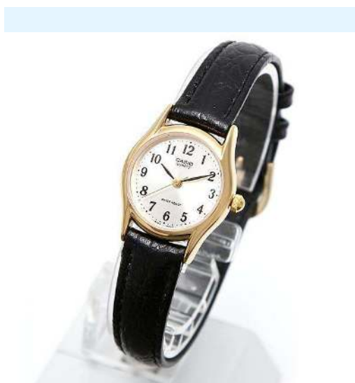
Casio Reloj para Dama LTP-1094Q-7B2RDF CRC 29,900.00