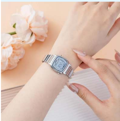
Casio Reloj para Dama LA670WA- 7DF CRC 27,200.00