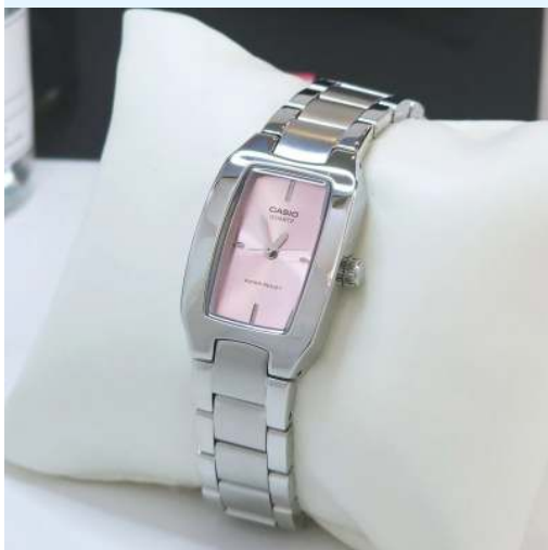
Casio Reloj para Dama LTP-1165A-4CDF CRC 39,800.00