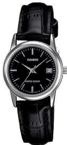
Casio Reloj para Dama LTP-V002L-1AUDF CRC 23,900.00