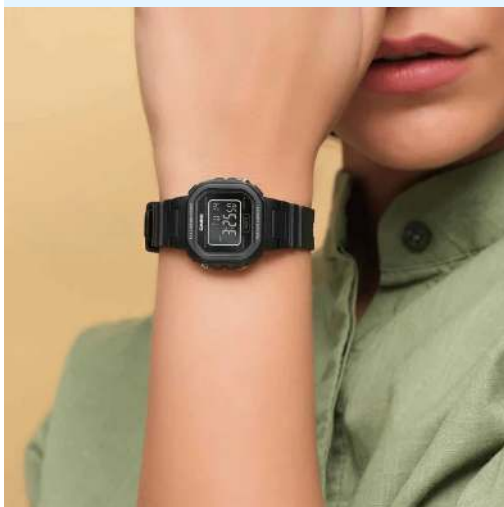
Casio Reloj para Dama / Niño LA- 20WH-1BDF CRC 19,900.00