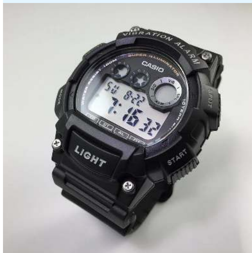
Casio Reloj W-735H-1AVCF CRC 39,900.00