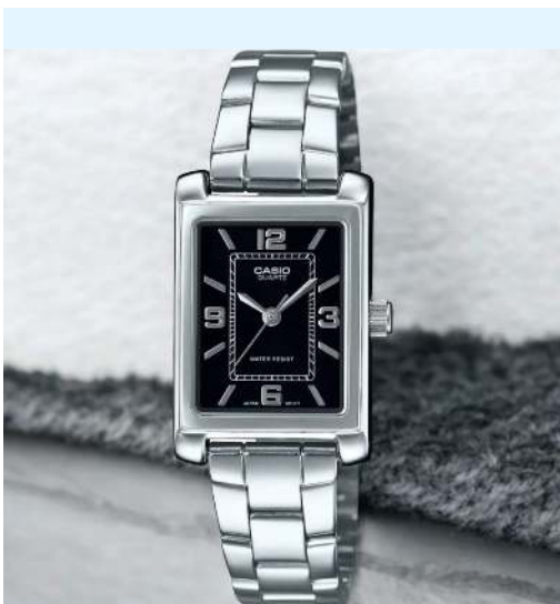
Casio Reloj para Dama LTP-1234DD-1ADF CRC 39,800.00