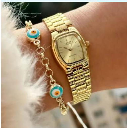
Casio Reloj para Dama LTP-1169N-9ARDF CRC 49,800.00