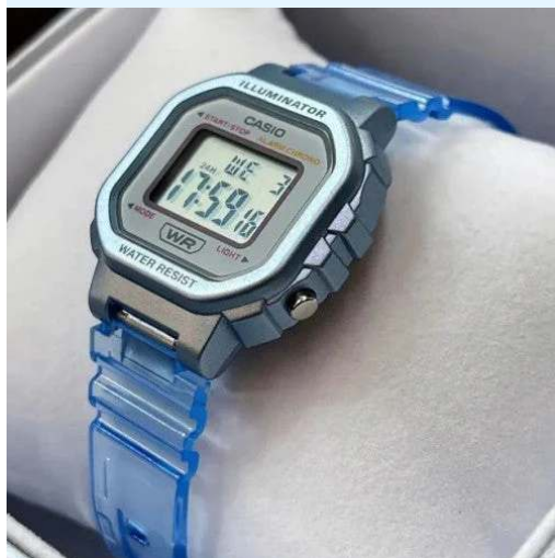
Casio Reloj para Dama / Niño LA- 20WHS-2ADF CRC 29,700.00