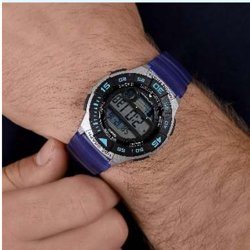
Casio Reloj para Hombre WS-1100H-2AVCF CRC 24,900.00