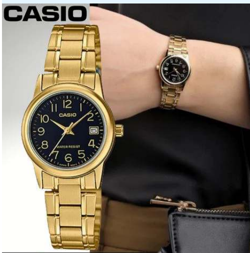
Casio Reloj para Dama LTP-V002G-1BUDF CRC 44,800.00