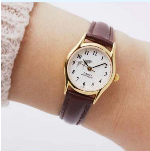
Casio Reloj para Dama LTP-1094Q-7B9RDF CRC 29,900.00