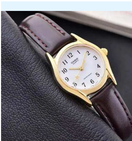
Casio Reloj para Dama LTP-1094Q-7B4RDF CRC 32,500.00