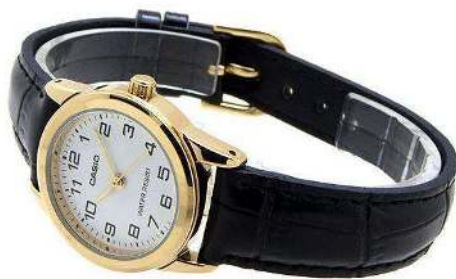
Casio Reloj para Dama LTP- V001GL-7BUDF CRC 27,200.00