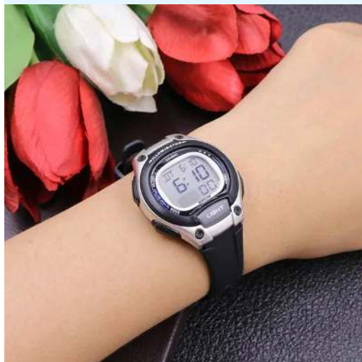
Casio LW-203-1AVDF CRC 27,200.00