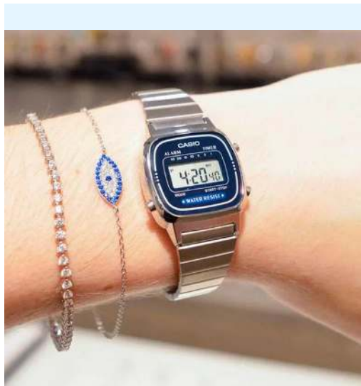
Casio Reloj para Dama / Niño LA670WA-2DF CRC 27,200.00