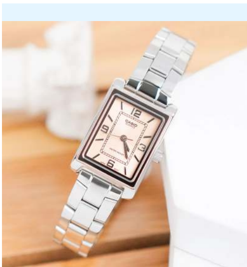
Casio Reloj para Dama LTP-1234DD-4ADF CRC 39,800.00