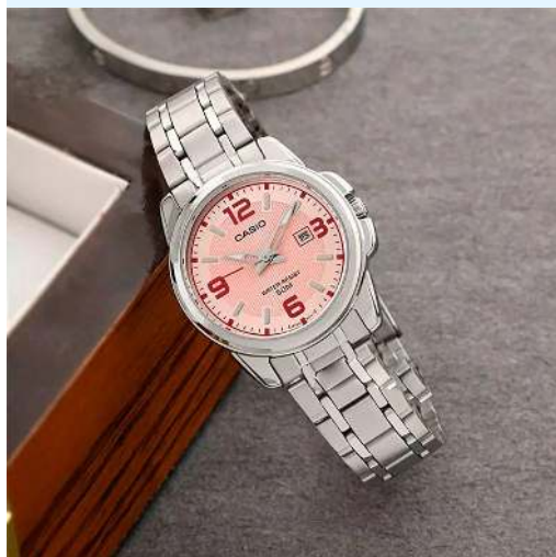
Casio Reloj para Dama LTP-1314D- 5AVDF CRC 38,400.00