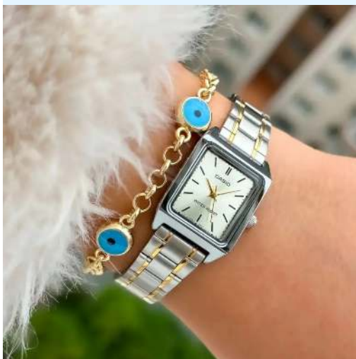
Casio Reloj para Dama LTP-V007SG-9EUDF CRC 29,900.00