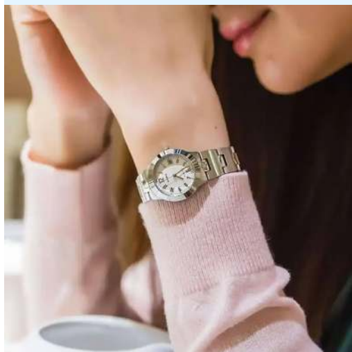
Casio Reloj para Dama LTP-1241D- 7A2DF CRC 36,500.00