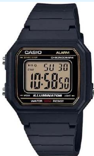
Casio Reloj para Hombre W-217H- 9AV CRC 19,500.00