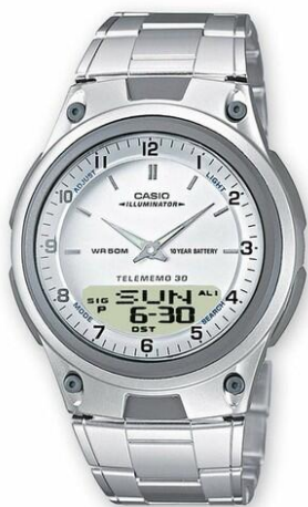
Casio Reloj para Hombre AW-80D-7AVCB CRC 39,900.00