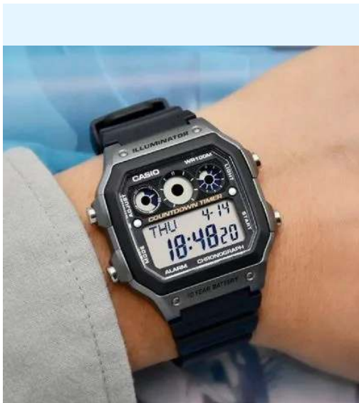
Casio Reloj AE-1300WH-8AVDF CRC 32,000.00