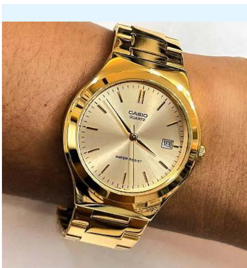
Casio Reloj Unisex Caja 36mm MTP-1170N-9ARDF CRC 39,800.00