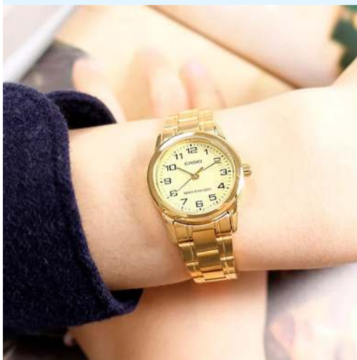
Casio Reloj para Dama LTP- V001G-9BUDF CRC 36,500.00