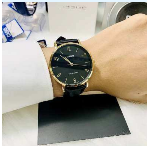
Casio Reloj UNISEX MTP-VT01GL- 1B2UDF CRC 36,800.00