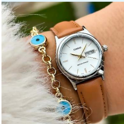
Casio Reloj para Dama LTP-V006L- 7B2UDF CRC 23,900.00