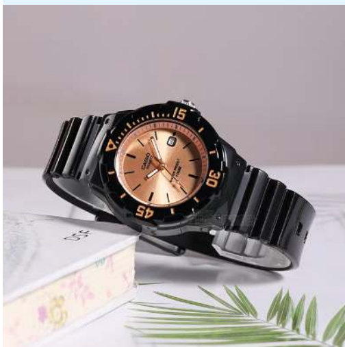
Casio Reloj Dama/Niña LRW- 200H-9E2VDF CRC 23,300.00