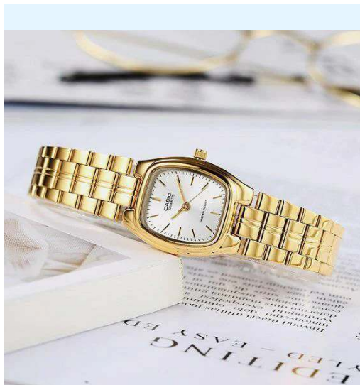
Casio Reloj para Dama LTP-1169N-7ARDF CRC 49,800.00