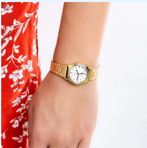
Casio Reloj para Dama LTP- V006G-7BUDF CRC 38,400.00