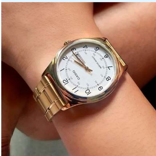
Casio Reloj para Hombre MTP- V006G-7BUDF CRC 38,400.00