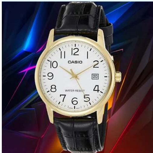
Casio Reloj MTP-V002GL-7B2UDF CRC 27,500.00