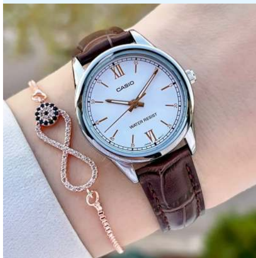
Casio Reloj para Dama LTP-V005L-7B3UDF CRC 23,900.00