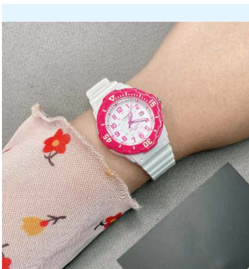
Casio Reloj para Niña LRW-200H- 4BVCF CRC 23,300.00