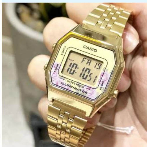
Casio Reloj para Dama LA680WGA-4CDF CRC 39,900.00