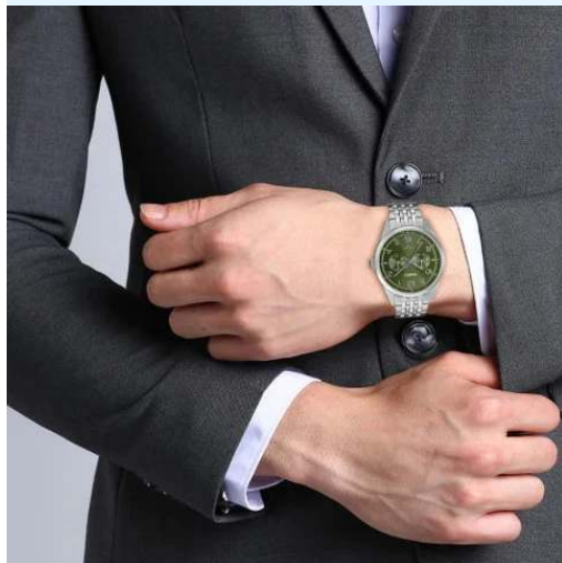
Casio WR50m Reloj para Hombre MTP-E340D-3AVDF CRC 69,900.00