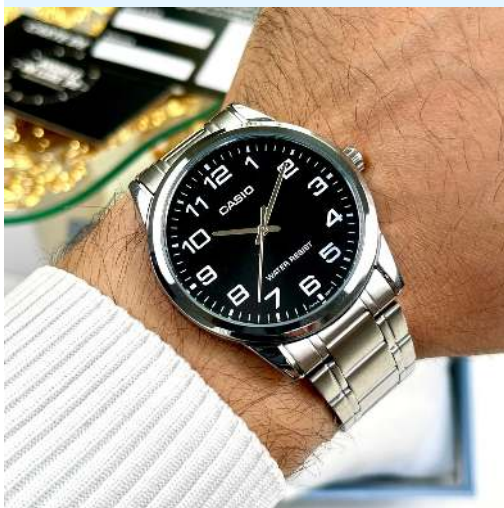
Casio Reloj para Hombre MTP- V001D-1BUDF CRC 25,000.00