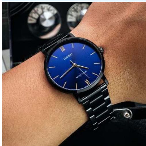
Casio Reloj MTP-VT01B-2BUDF CRC 48,000.00