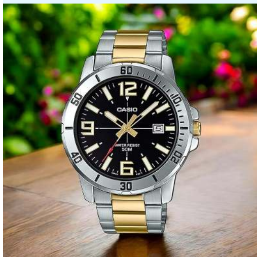
Casio Reloj para Hombre MTP- VD01SG-1BVUDF CRC 44,800.00