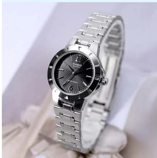
Casio Reloj para Dama LTP-1177A-1ADF CRC 29,900.00