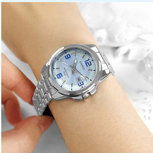
Casio Reloj para Dama LTP-1314D- 2AVDF CRC 38,400.00