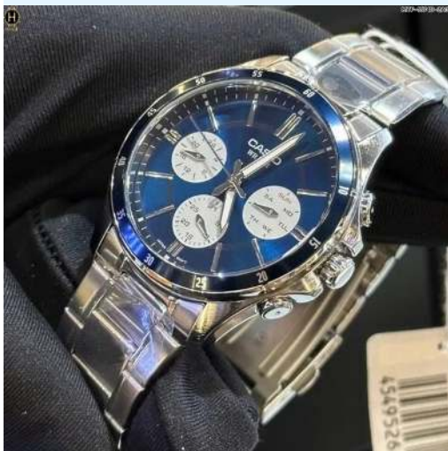
Casio Reloj para Hombre MTP- 1374D-2A3VDF CRC 59,900.00