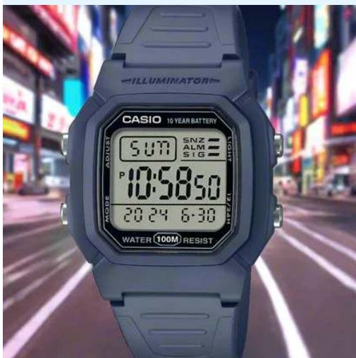
Casio Reloj para Hombre W-800H- 2AVDF CRC 25,600.00