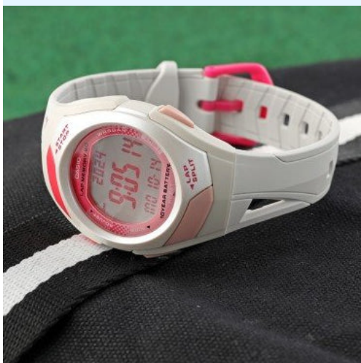
Casio Reloj Dama STR-300-7CF CRC 33,600.00