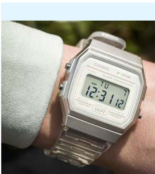
Casio Reloj Dama F-91WS-7CF CRC 27,800.00