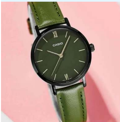
Casio Reloj LTP-VT02BL-3AUDF CRC 34,000.00