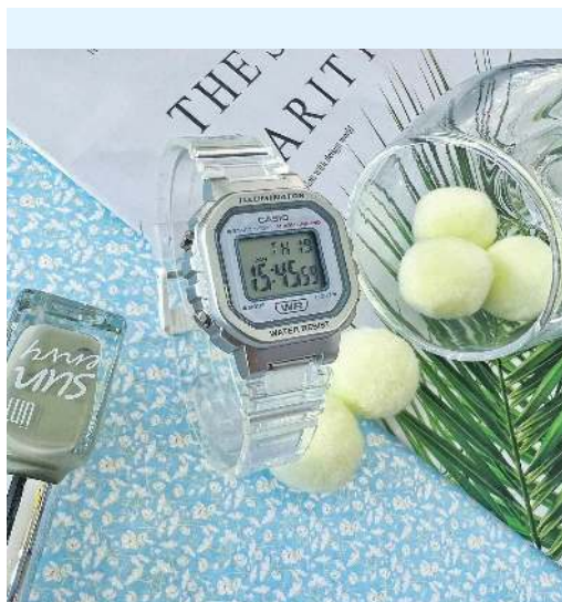
Casio Reloj para Dama LA-20WHS-7ACF CRC 29,900.00