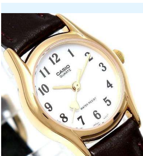
Casio Reloj para Dama LTP-1094Q-7B5RDF CRC 29,900.00