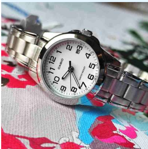
Casio Reloj para Dama LTP-1215A-7B2DF CRC 28,900.00