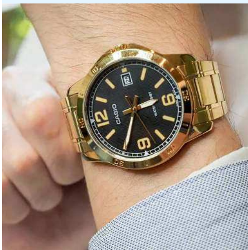
Casio Reloj para Hombre MTP- V004G-1BUDF CRC 39,800.00