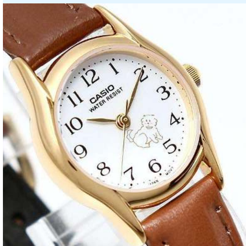
Casio Reloj para Dama LTP-1094Q-7B7RDF CRC 29,900.00