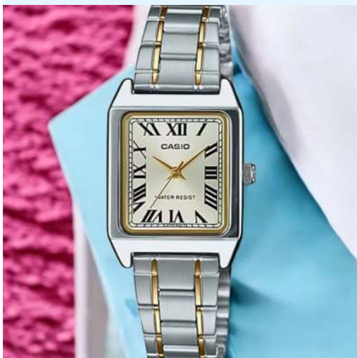
Casio Reloj para Dama LTP-V007SG-9BUDF CRC 36,000.00