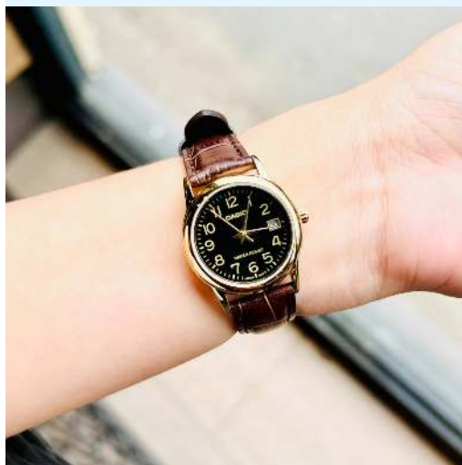
Casio Reloj para Dama LTP- V001GL-1BUDF CRC 27,200.00