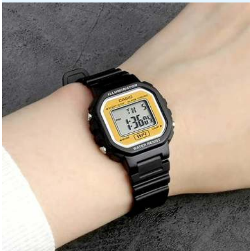
Casio Reloj para Dama / Niño LA- 20WH-9ADF CRC 17,900.00