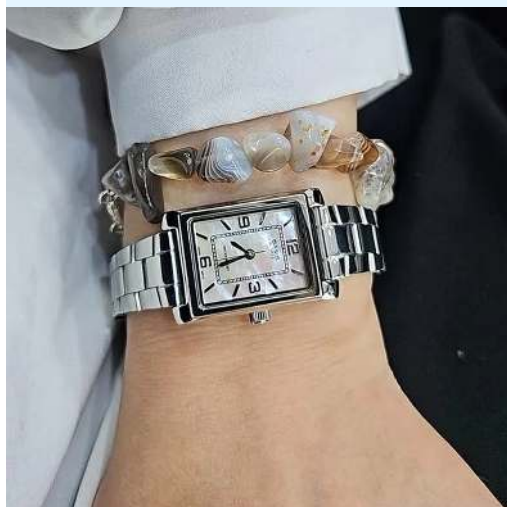
Casio Reloj para Dama LTP- 1234DS-4ADF CRC 39,800.00