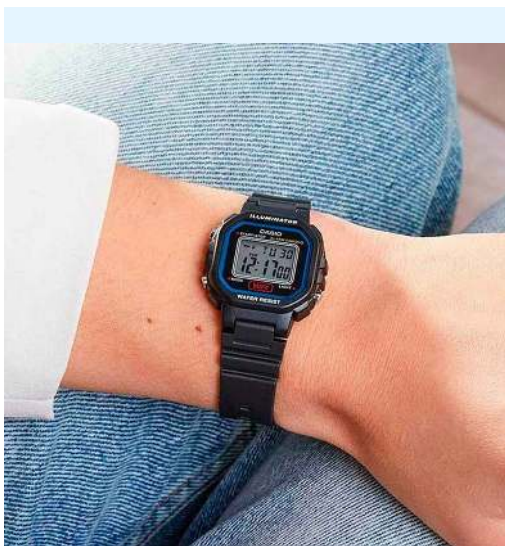
Casio Reloj para Dama LA-20WH- 1CDF CRC 17,900.00