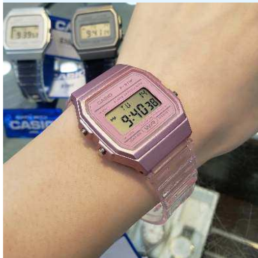
Casio Reloj Dama F-91WS-4CF CRC 29,800.00